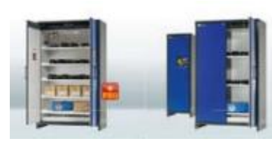
PRODUIT DANGEREUX/ RISQUE CHIMIQUE ASECOS

Service sur-mesure de mise à disposition de protections intimes 100% Bio.