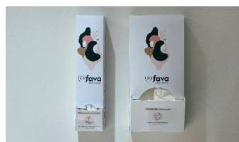
SERVICE AUX COLLABORATRICES FAVA FAVOPRO

Barrière Virtuelle - Ligne de Vie et de Sécurité permettant de protéger les personnels.