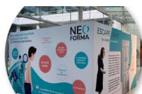
POSTURES AU TRAVAIL / PREVENTION DES TMS NEO FORMA/OSTEO ENTREPRISE

Chariot électrique de manutention intuitif et utilisable par tous.