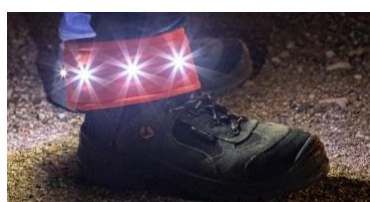
SECURITE DE LA PRODUCTION ET DES CHANTIERS MY ANGEL PTI-DATI LVSL / SAFE INNOV

Barrière Virtuelle - Ligne de Vie et de Sécurité permettant de protéger les personnels.