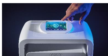
HYGIENE / HYGIENE DE L'AIR NatéoSanté EOLIS Air Manager

Film antimicrobien contre les virus et les bactéries, actif 24h/24, 7j/7 jusqu'à 5 ans.