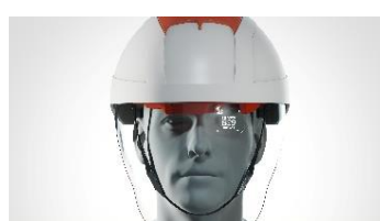
EQUIPEMENTS DE PROTECTION INDIVIDUELLE NEORATECH

Plateforme d'Apprentissage Immersif en 360° et Réalité Virtuelle.