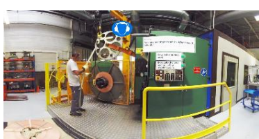
E FORMATION / REALITE VIRTUELLE UPTALE

Solution globale clé en main pour alerter et porter assistance au travailleur isolé.