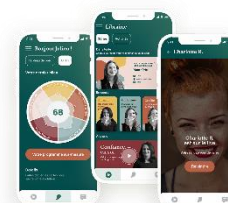
PREVENTION DES RPS TEALE

Outil de prévention des TMS basé sur la Motion Capture et la Réalité Virtuelle.