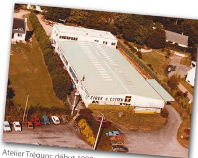
Atelier Trégunc début 1980