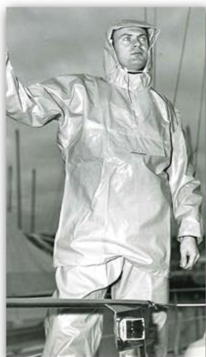
Anorak DRENEC 1976