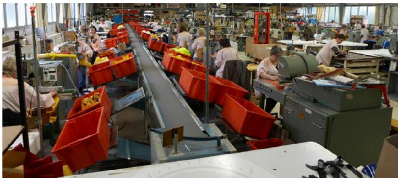
Ateliers de Trégunc (Finistère)

De 1964 à 2014, il y a 50 ans que le nom GUY COTTEN parcourt les mers du globe, foule les champs et se balade sur les sentiers côtiers.