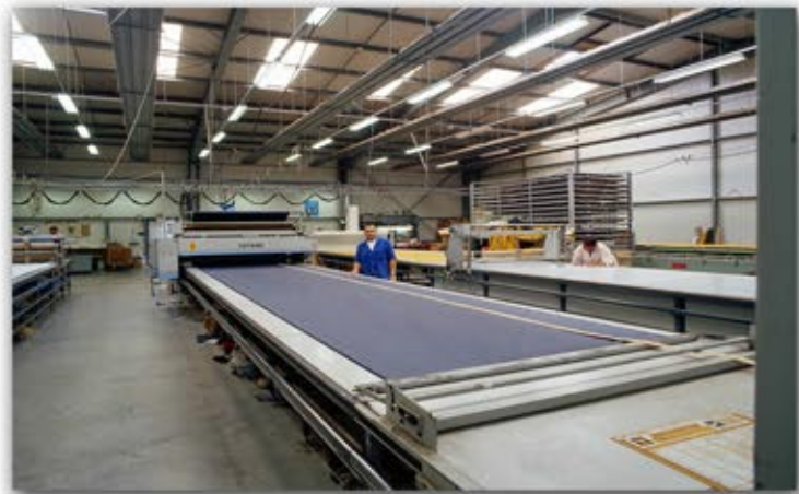
Tables de coupe des tissus