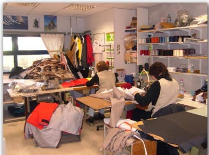
Atelier des prototypes et SAV