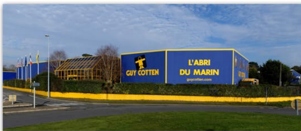
Siège de la Société et atelier 2014