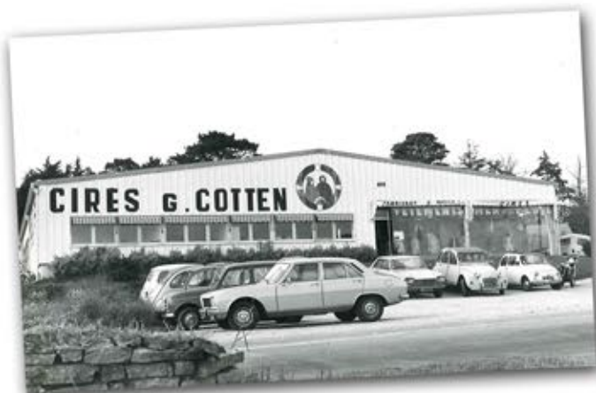
Atelier Trégunc 1975