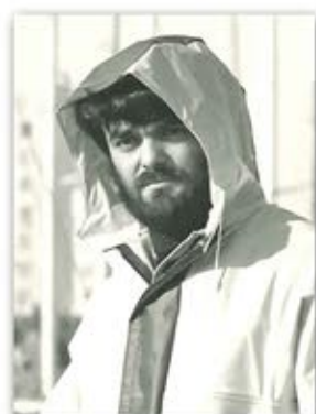
Veste LABRADOR 1980