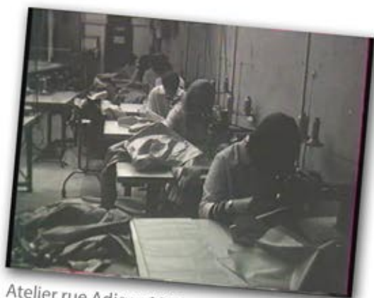
Atelier rue Adigar 1968