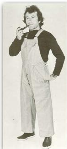
Cotte à bretelles 1974