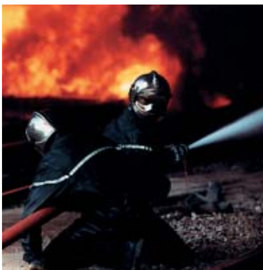
Les fumées présentent un danger d'opacité.

Etant donné que le comburant (oxygène de l'air) est toujours présent sur les lieux de travail et qu'il y a presque toujours des combustibles (matériaux de construction ; produits manipulés, stockés, fabriqués ; ...), tous les établissements industriels et commerciaux présentent des risques d'incendie dès lors qu'il y aura présence de sources d'énergie.